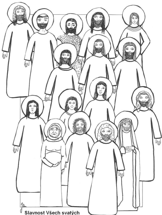
Slavnost Všech svatých Mt 5,1-12a